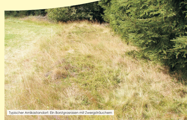
Typischer Amikastandort: Ein Borstgrasrasen mit Zwergsträuchern

In mythologischer Hinsicht hat man Arnika verwendet, um Gefahren vorzubeugen, wie Blitz, Hagel und auch Hexen fernzuhalten. Bauern brachten sie an den Ackerrändern an, wo sie bis nach der Ernte verblieb, um den „Bilmesschneider“ abzuwehren, eine Legendenfigur die nachts im Mondlicht auf einem Geißbock durch die Felder reitet und das Getreide abschneidet.