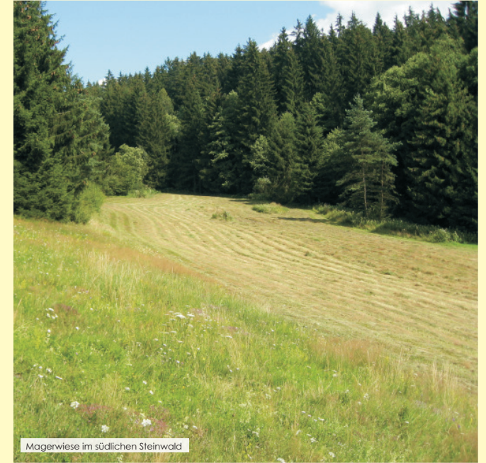
Magerwiese im südlichen Steinwald

Aus landwirtschaftlicher Sicht betrachtet, stellt die Arnika einen Bodenräuber dar. Durch ihre teilweise sehr dicht am Boden liegenden Rosetten nimmt sie anderen Futterpflanzen den Platz weg und wird frisch nur von Ziegen beweidet. Kommt sie auf einer Fläche häufig vor und wird dabei über das Heu von Kühen gefressen, wird deren Harn blutig.