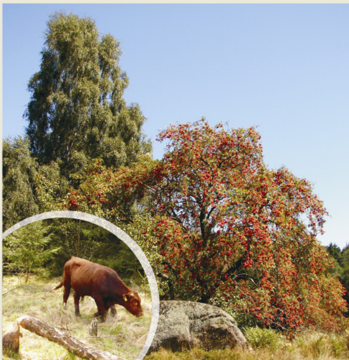
Das Rotvieh um Friedenfels teilt seine Waldweide mit der Kreuzotter, dem Biber und einer Vielzahl an Spinnen- und Insektenarten.

Findlinge und Lesesteinhaufen mitsamt der charakteristischen Einzelbäume und Heidelbeersträucher zählen zu den typischen Landschaftselementen des Steinwaldes. Sie gilt es zu erhalten.